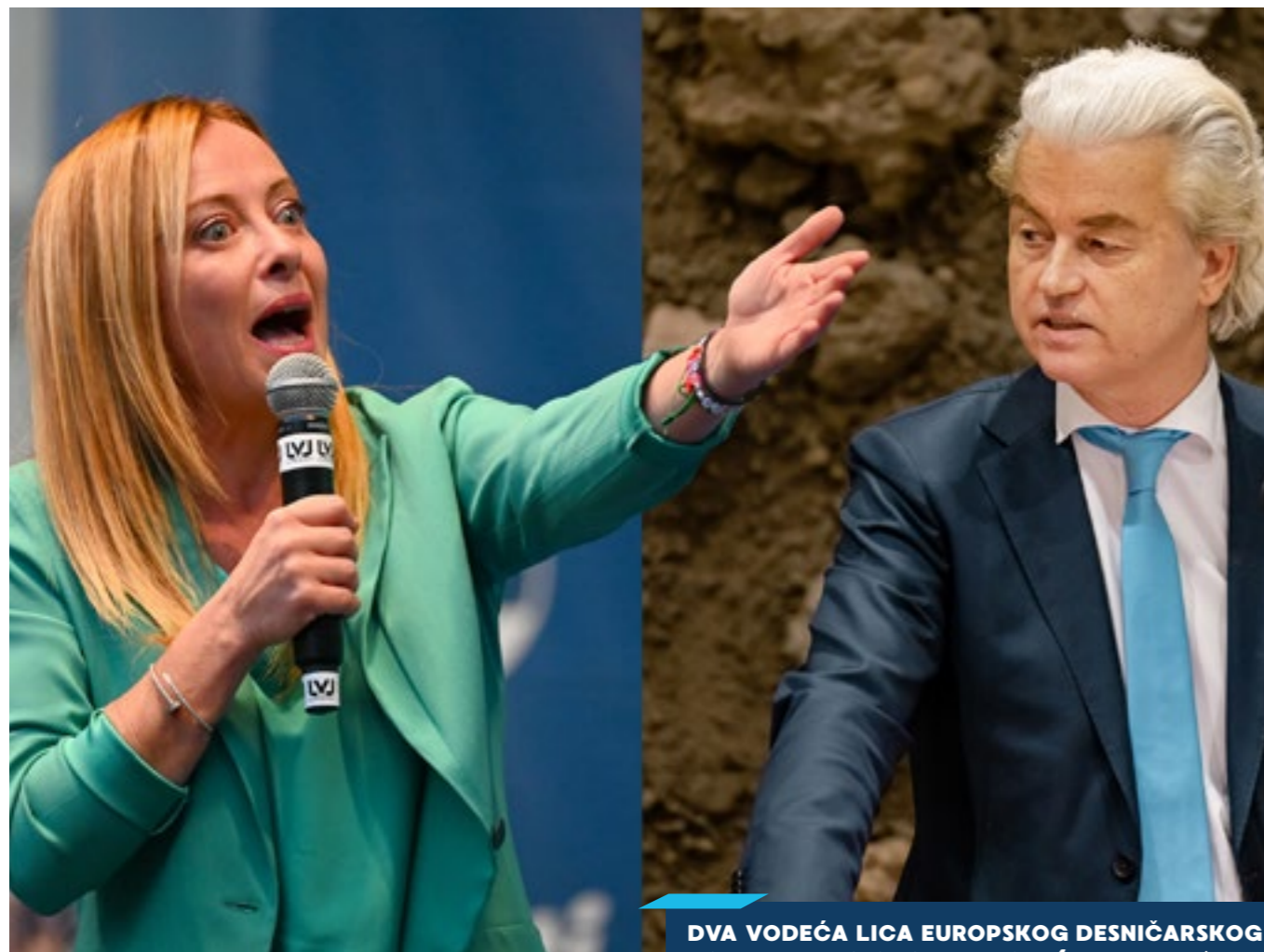
DVA VODEĆA LICA EUROPSKOG DESNIČARSKOG POPULIZMA: GIORGIA MELONI (FRATELLI D'ITALIA) I GEERT WILDERS (PVV)

O učincima i posljedicama mogućeg skretanja udesno na europskim izborima 2024. po radničke organizacije, socijalnu državu i europske demokracije.