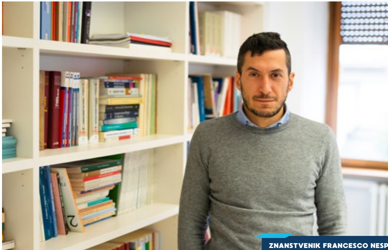
ZNANSTVENIK FRANCESCO NESPOLI S RIMSKOG SVEUČILIŠTA LUMSA

godine. „Da, zabrinut sam. Bojim se da će desničarski populisti oslabiti parlament. Do sada smo izradili dubinske analize rada i ponašanja prilikom glasanja u Europskom parlamentu. U većini slučajeva se oko socijalne politike slažu gotovo sve skupine u odborima, od ljevice do liberala. Protive se samo članovi ECR-a i Id-a, koji principijelno odbijaju prijedloge za europsku minimalnu plaću ili borbu protiv siromaštva unatoč zapošljavanju. Njihov je argument to da je ovdje riječ o nacionalnim pitanjima u koja se EU ne bi trebala miješati.“