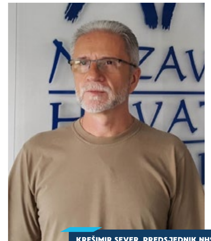
KREŠIMIR SEVER, PREDSJEDNIK NHS-A (NEZAVISNI HRVATSKI SINDIKATI)

Zbog digitalizacije svijeta rada IT zauzima privilegiran položaj. U drugim se područjima budućim zaposlenicima toliko ne udvara. Oni koji su već zaposleni, do sada su imali male šanse za daljnje usavršavanje. NHS to želi promijeniti. Zajedno s hrvatskom Vladom i poslodavcima, sindikati su osmislili vaučere za obrazovanje koje financira EU. Za ove se vaučere mogu prijaviti zaposleni i nezaposleni. Na portalu Hrvatskog zavoda za zapošljavanje može se pronaći gotovo 1000 tečajeva raznih privatnih obrazovnih institucija. Ponuda seže od UX dizajna preko održavanja hibridnih automobila do digitalnog marketinga. Tečajevi se održavaju online ili na licu mjesta i obično traju nekoliko stotina sati. Prema NHS-u je potražnja dosad bila suzdržana.