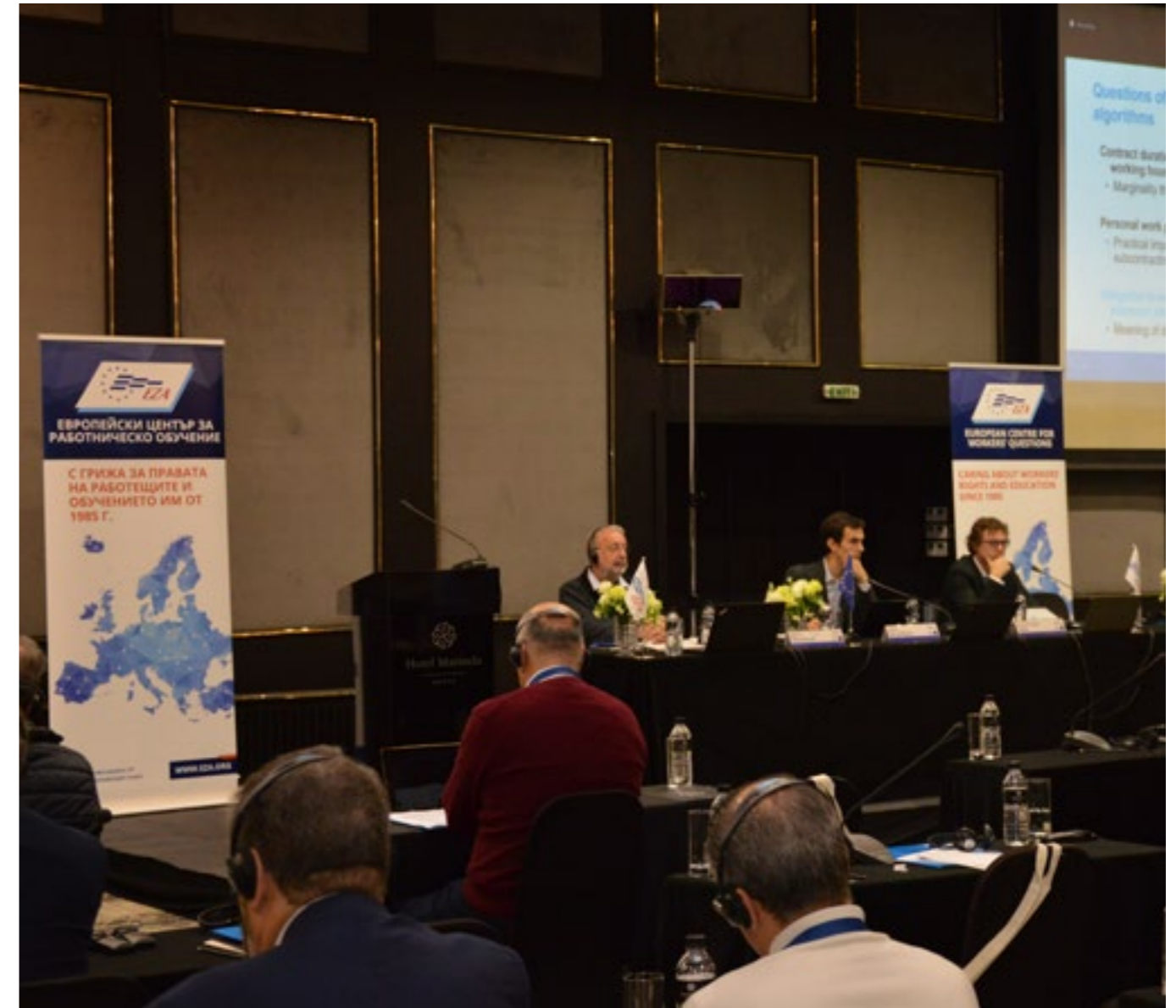
TEKSTOVI: Sergio De la Parra

Temeljna poruka ovogodišnjeg EZA-inog uvodnog seminara bila je jasna: „Crna kutija se može otvoriti!“ Predstavnici radnika imaju dužnost demistificirati sustave s umjetnom inteligencijom (UI) i podržati rad-